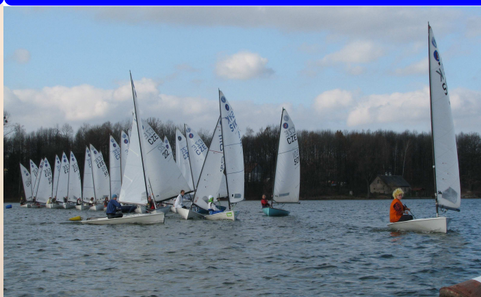
2. ročník: Těrlicko 2008