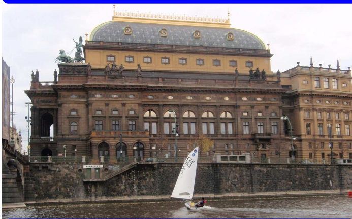
4. ročník: Praha 2010