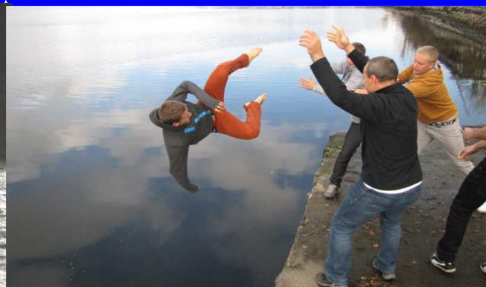
7. ročník: Brno 2013