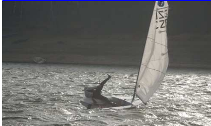
6. ročník: Seč 2012