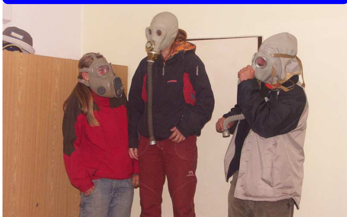
1. ročník: Chomoutov 2007