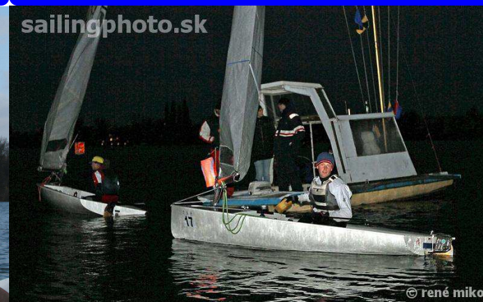
3. ročník: Senec 2009